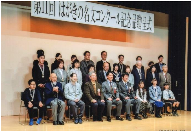
記念品贈呈式(全受賞者)

1月中旬まで、このコンクールの入賞関係で、東京での発表会(12月)、地元市長への報告会(1月)、奈良県での表彰式(1月)と、いろいろその準備も含めて完全に生活が変わった。