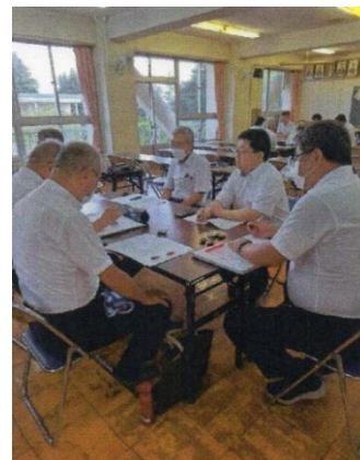
グループ懇談の様子

運営面では喜多方一小校長先生、職員の皆様に大変お世話になりました。心より御礼を申し上げます。