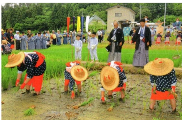
神田での早乙女による田植え風景

子どもは地域の宝物です。これからも生涯学習の中核として、地域作りの拠点として、微力ながら活性化に貢献しようと思います。