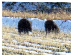
田んぼの中のイノシシ

○ クマの出没ばかりが話題となっていますが、イノシシの出没も多いようです。我が家のまわりでは、キジも多く見られます。