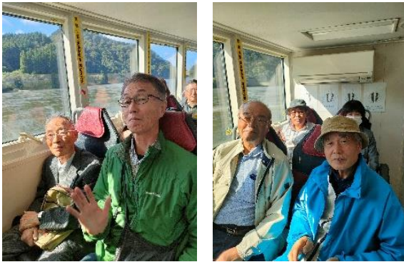
阿賀川下りの遊覧船の中で