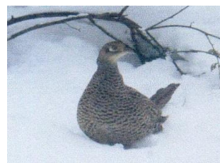
樹木の根元に蹲るキジ