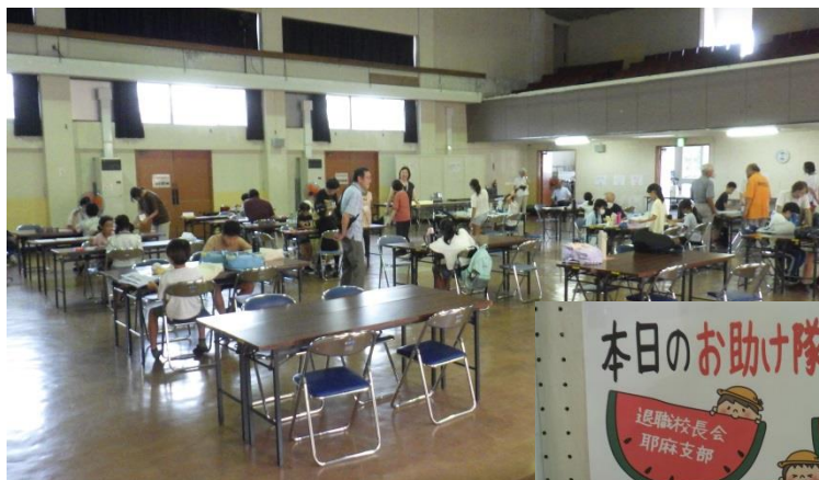
8月21日(木)「夏休み宿題お助け 広場」の様子と協賛団体紹介(右)