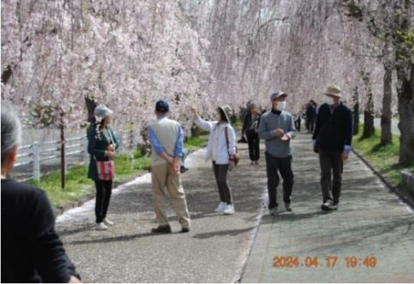
旧日中線枝垂れ桜ウォーク

高齢者が多いので、実施にあたっては「普段の運動不足を解消し体力の維持・向上を図るような、ウォーキングや草花鑑賞等、自然と触れ合う活動を多く取り入れる」ように配慮しています。勿論、会員の健康状態や熱中症、クマ等への注意は欠かせません。