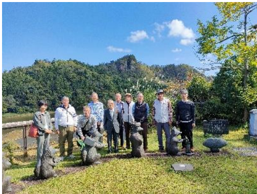
狐の嫁入り屋敷前庭にて（背後は麒麟山）